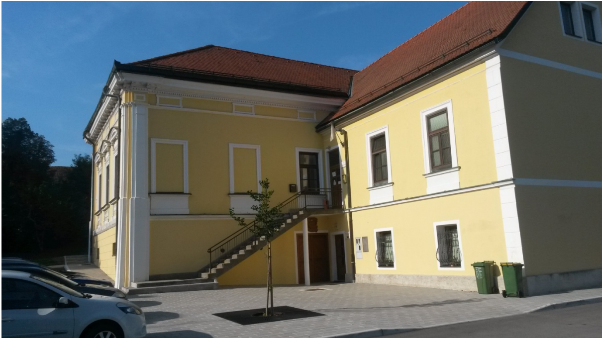
POGLED S SEVERA