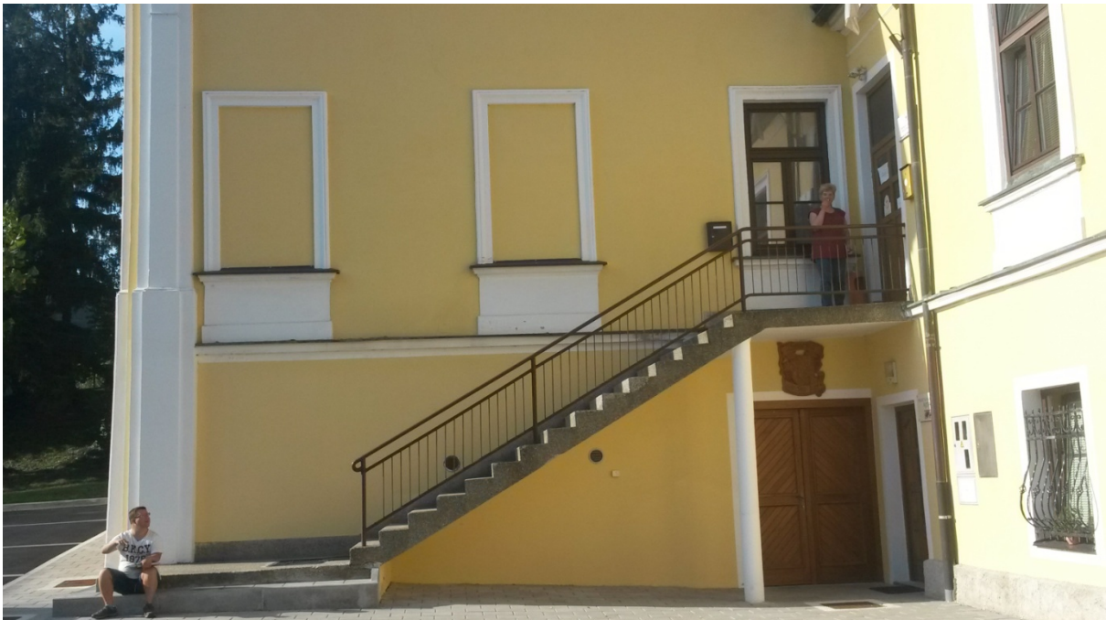
POGLED NA OBRAVNAVANE STOPNICE